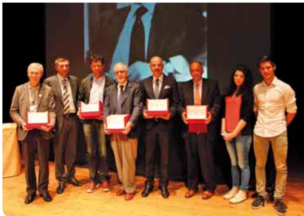
Tutti i premiati del Giorgio Lago 2014