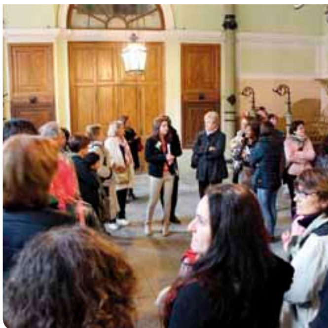
Un momento della riapertura delle Scuderie (giornate F.A.I.)