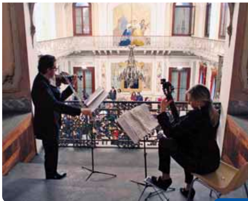
Uno dei concerti in Sala da ballo (giornate F.A.I.)