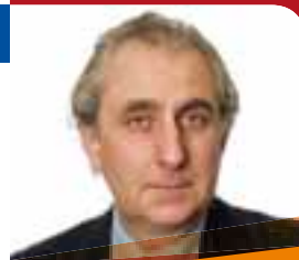
GIANCARLO SARAN Assessore alla cultura, al turismo, all'identità veneta