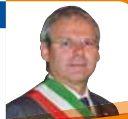
On. LUCIANO DUSSIN Sindaco

Forti le preoccupazioni per una situazione economica insostenibile