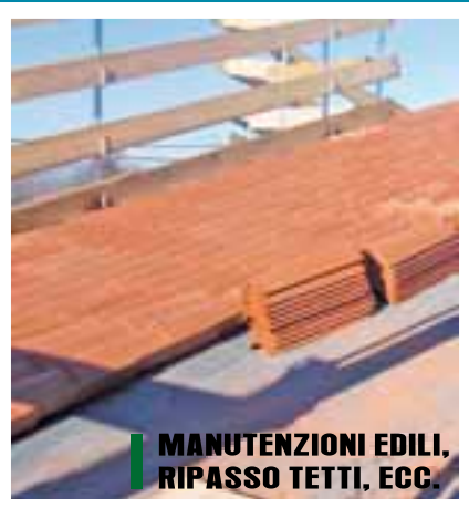
■ MANUTENZIONI EDILI, RIPASSO TETTI, ECC.