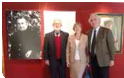
Mostra Barbisan - Il Prefetto in visita

Nella Galleria espositiva del teatro si sono alternati protagonisti diversi. Un'esplorazione fotografica degli "ultimi" di Calcutta, ovvero volti e situazioni che solo un occhio esperto e sensibile può cogliere, al di là dei tradizionali flussi turistici, come in questo caso il belga Marc de Tollenaere. A seguire un originale "Asfalti", dove l'estro un po' "gipsy" del cittadellese Giancarlo Gennaro ha immortalato aspetti molto... "terra terra" di colori, geometrie e linguaggi diversi che