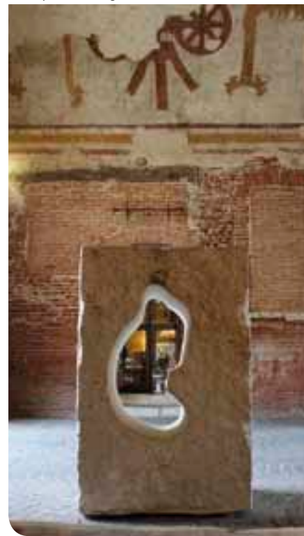
Un'opera di Vincenzo Momoli esposta sotto le volte della Torre Civica