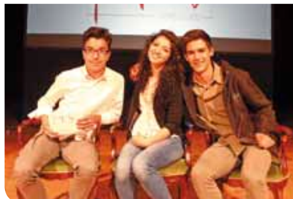
I vincitori del Premio Lago juniors