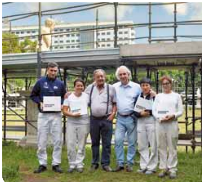
I restauratori delle statue con il "guardiano" di Bolasco