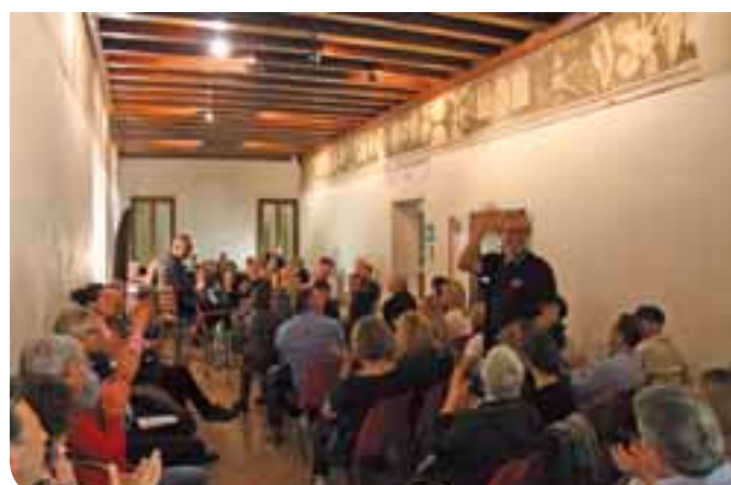
Un momento dei vari eventi entro il Museo