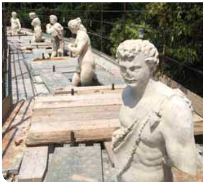
Le statue di Orazio Marinali stanno riemergendo dall'oblio

I lavori dell'intero compendio andranno rendicontati entro al fine del 2015, quindi è prevedibile che i lavori termineranno verso l'autunno dello stesso anno.