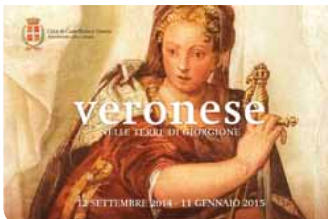
La cartolina della Mostra "Veronese nelle terre di Giorgione" - dal 12 settembre 2014 all'11 gennaio 2015