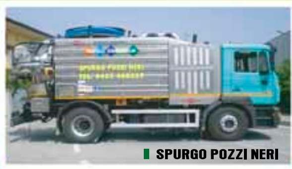
■ SPURGO POZZI NERI