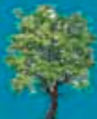
potatura siepi e piante