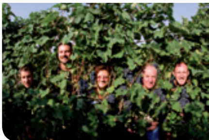
La Famiglia Manera, qui ritratta da Renato Vettorato

L'attività del Teatro Accademico è proseguita nella tradizione di un calendario di spettacoli che tocca diversi temi di interesse. Dalla stagione di prosa, svolta in collaborazione con ArteVen, alla stagione musicale che, quest'anno, ha visto protagonista nella cabina di regia della direzione artistica il Conservatorio A. Steffani con una serie di eventi di altissimo livello riuniti sotto il progetto "Chiave Classica CFV 2013". Diversi gli interlocutori che hanno scelto il Teatro Accademico come partner per illustrare le loro attività, dal Progetto Pastrello al circolo fotografico El Pavejon e molti altri.