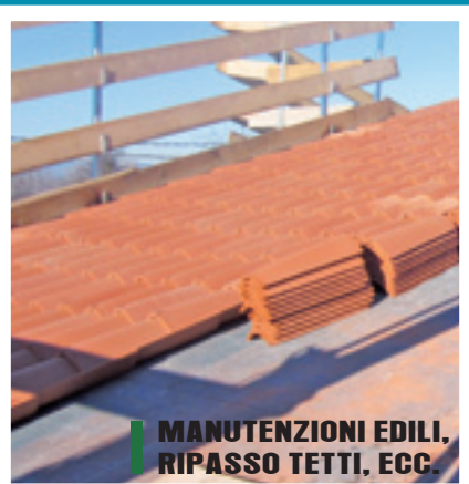
■ MANUTENZIONI EDILI, RIPASSO TETTI, ECC.