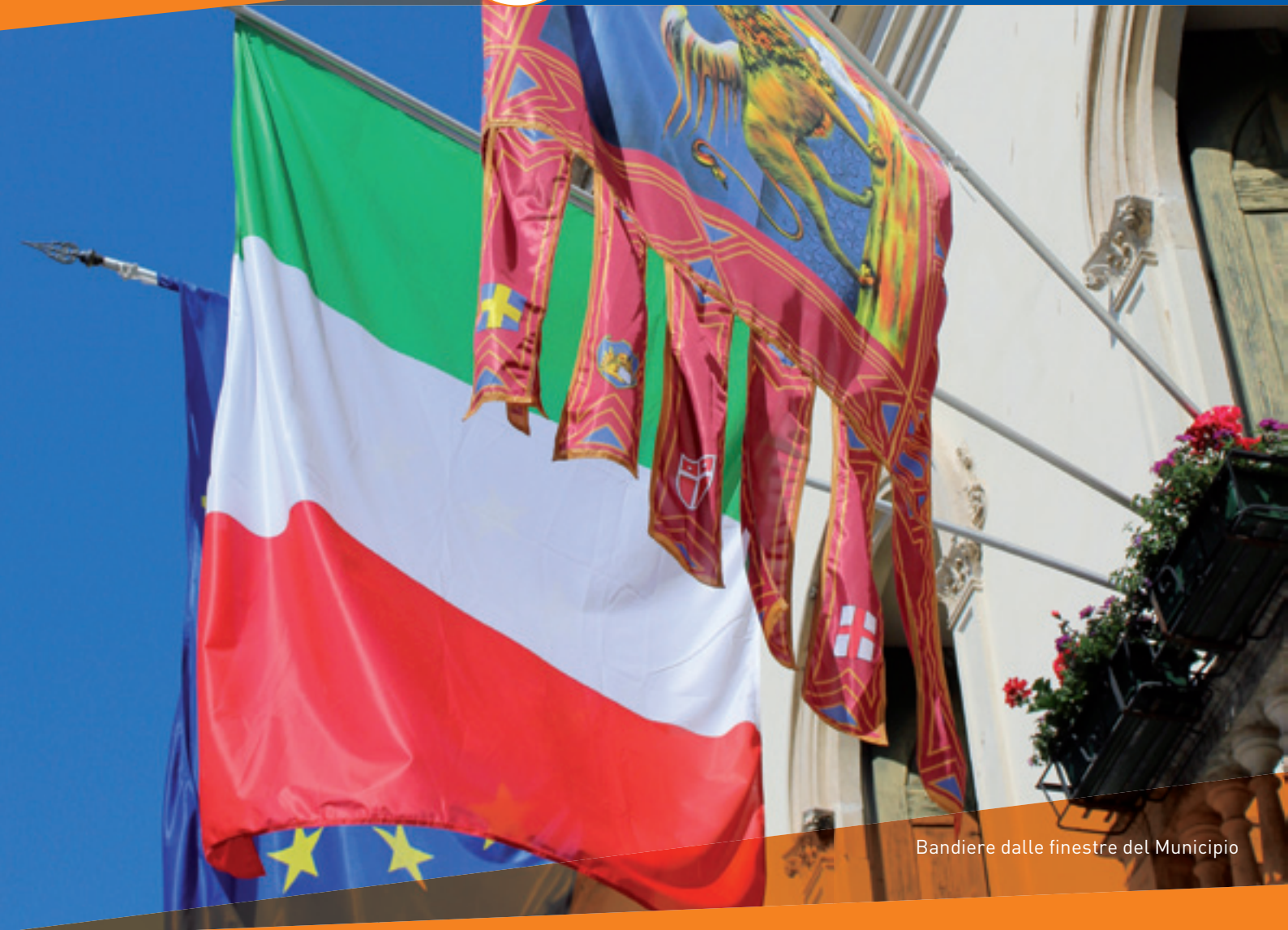
Bandiere dalle finestre del Municipio

SEMESTRALE D'INFORMAZIONE DEL COMUNE DI CASTELFRANCO V.TO