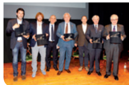
I vincitori del Premio Giorgio Lago 2013

Grande successo anche per il Premio Nina Scapinello, organizzato dalla Compagnia Guido Negri e dal locale Lions Club, che ha premiato i migliori lavori originali in lingua veneta per tenere viva l'opera dell'indimenticabile Nina nel decennale della scomparsa. In vista dei lavori di restauro di Parco e Villa, anche Bolasco è protagonista dell'estate cittadina. La terza edizione di "Bolasco dipinge" ha ospitato l'Associazione dei pittori rosatesi, cui è seguita una importante mostra di scultura di un giovane trevigiano che farà sicuramente strada, Giovanni Pietrobon con "Donne, donne, eterni dei", in cui la fonte di ispirazione, oltre all'universo femminile, è stato l'affascinante mondo della Lirica.