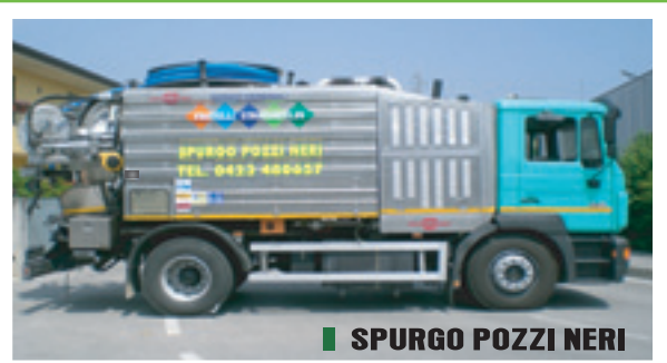
■ SPURGO POZZI NERI