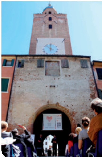
L'inaugurazione della Mostra "5x5" entro la Torre Civica

La Campagna per la salvaguardia delle Mura cittadine procede, cambiando passo. In questi mesi si è puntato molto sulla informazione, sulla sensibilizzazione della cittadinanza, del mondo associativo. I risultati sono concreti. Oltre 12.000 firme. Una rassegna stampa di oltre un centinaio di articoli. Diversi servizi televisivi. Ora si sta lavorando su due binari. Da un lato la massima valorizzazione della Torre Civica, recentemente restaurata. A metà maggio