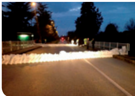
La piena del Muson

Con l'applicazione dello stesso Regolamento, mediante avviso ai proprietari ad eseguire i lavori prescritti, nelle zone dove si è intervenuto, sono state definitivamente risolte le problematiche inerenti gli allagamenti sia delle strade pubbliche che delle proprietà private con la piena collaborazione da parte dei cittadini coinvolti. Altri interventi sono in corso di procedura e l'Amministrazione comunale confida nella più ampia collaborazione da parte dei cittadini per la risoluzione di tale problematiche che significa più sicurezza sulle strade, minori costi pubblici ed evidenti ripercussioni positive per l'ambiente in generale.