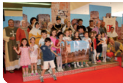
Il Concorso per le scuole elementari, con tema la salvaguardia delle Mura, ha visto premiata la Classe II A di Salvarosa