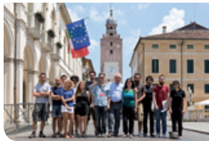
L'Assessore Saran con gli undici fotografi venuti cinque giorni a Castellana Grotte per la salvaguardia delle Mura

Sul versante della comunicazione, invece, a fine Giugno si è svolto "LNM 10",