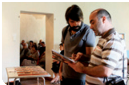
Grande successo per la presentazione della Guida de "Il Duomo"