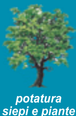
potatura siepi e piante