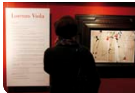
Grande successo della Mostra dedicata al pittore Lorenzo Viola, con un boom di oltre 1300 bambini iscritti ai laboratori scolastici

Dal Museo civico di Bassano a quello di Verona, passando per la Gipsoteca del Canova e altre istituzioni veneziane e non. Un Museo, quindi, grazie anche alla regia del suo direttore Luca Baldin, sempre più proiettato ad essere protagonista e indispensabile interlocutore per lo sviluppo di una Città, quale Castelfranco Veneto, nel cui dna, da sempre, albergano punti di forza strategici, ma sinora mai valorizzati a sistema, sul piano del patrimonio storico e delle relative potenzialità di attrazione turistica conseguenti.