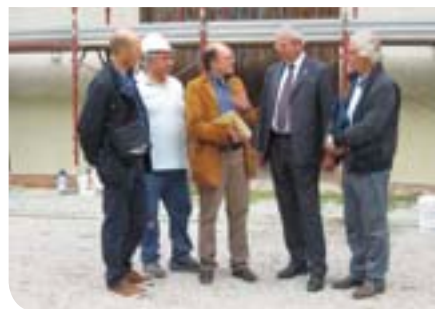
Il restauro delle scuderie

Se il Parco, quindi, è precluso ora al pubblico, in quanto già sono iniziati i lavori, quest'estate è stato ancora possibile usufruire dei due cortili interni della Villa, nonché del prestigio-