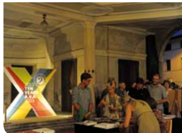
Uno dei tanti momenti delle serate in Villa

Entro l'inverno, tra l'altro, dovrebbe venire anche inaugurata la sede provvisoria del Centro del Restauro entro alcuni locali della Villa, grazie all'intervento di un primario (e storico) istituto bancario cittadino.