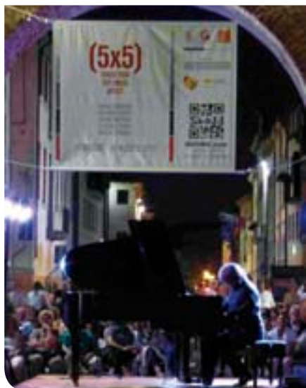
Una delle serate estive sotto la Torre civica