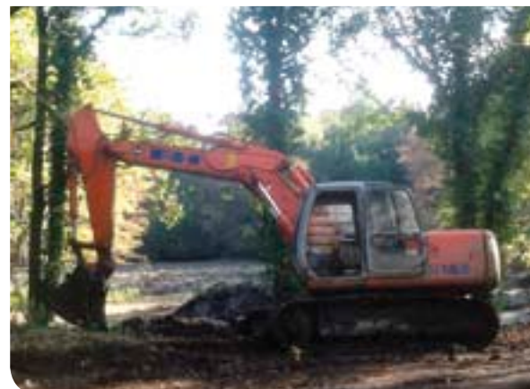
Nel parco si lavora e come si lavora!

Un'ulteriore tappa di una serie di interventi che, nell'estate del 2015, dovrebbero restituire alla Città una delle sue ricchezze più amate.