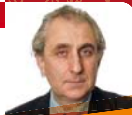
GIANCARLO SARAN Assessore alla cultura, al turismo, all'identità veneta

Altro importante tassello a testimonianza dell'impegno profuso da diversi interlocutori per il recupero dell'intero compendio, il restauro delle antiche Scuderie, grazie ad una sinergia tra l'Amministrazione comunale (che si è fatta carico di mettere in sicurezza gli interni), il Rotary Club di Castelfranco-Asolo e la Conartigianato della castellana, che ha riportato all'antico splendore gli intonaci della facciata sud.