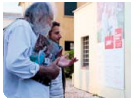
Un momento dell'inaugurazione della Mostra Fotografica LNM 10

Museo inteso come casa aperta, ai cittadini così come ad altre associazioni, dal Conservatorio agli Amici dei Musei, con una serie regolare di eventi, concerti, conferenze in primis. All'interno delle sale del Museo, due le iniziative importanti. Una mostra fotografica "LNM 10 - Fotografi in residenza", descritta in altra pagina, e una di pittura "Eros Florale, 10", con cui il noto artista cittadino, Lorenzo Viola, ha voluto ricordare i suoi 60 anni di attività tra tele, pennelli e non solo. Di particolare valore il ciclo di conferenze "Le Macchine del tempo", dedicata a un tour virtuale entro i principali Musei della Regione, grazie alla testimonianza dei loro Direttori.